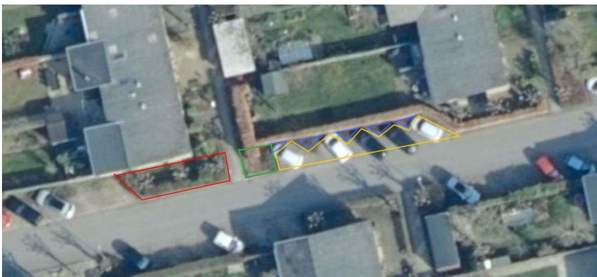
Luftfoto med farveangivelse af de omtalte arealer.